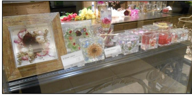
パレスホテル東京（オリエンタルフローリスト店内 BI）