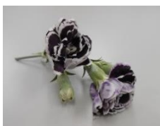
ダイアンサス (ブラックジャック)