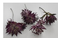
アストラランチャー (濃紫)