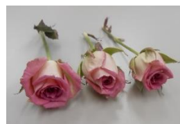
湘南キャンディーピンク