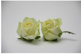
1・アバランチエ(ホワイト系)