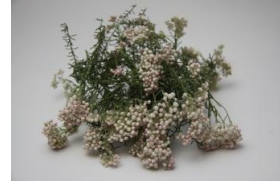
17・ライスフラワー