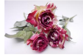
11・ファイヤーワークス