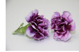
1・クレイジー(ピンク系)