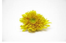
3・ひまわり(東北八重)