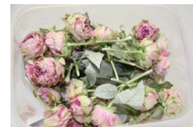
5・センセーション