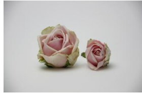
2・スイートアバランチエ (ピンク系)