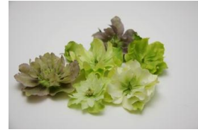
1・クリスマスローズ