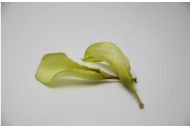
8・カラー(イエロー系)